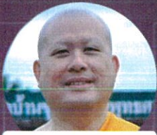
Phra Paramai Dhanissaro

📍 Le Lotus, 2 nd floor, Swissotel Ratchada Bangkok