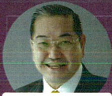
Dr. Surakiart Sathirathai

📍 Le Lotus, 2 nd floor, Swissotel Ratchada Bangkok